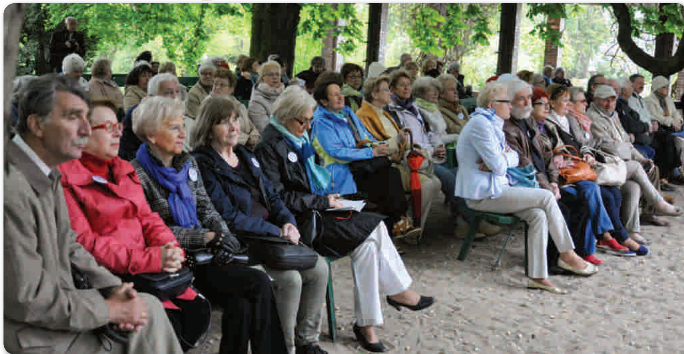
Mimo chłodnej niedzieli, goście licznie przybyli na piknik jubileuszowy