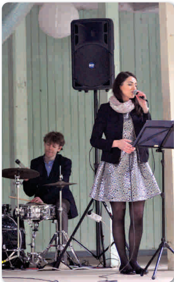
Przemówienia przeplatane znane i lubiane hity z repertuaru polskich artystów