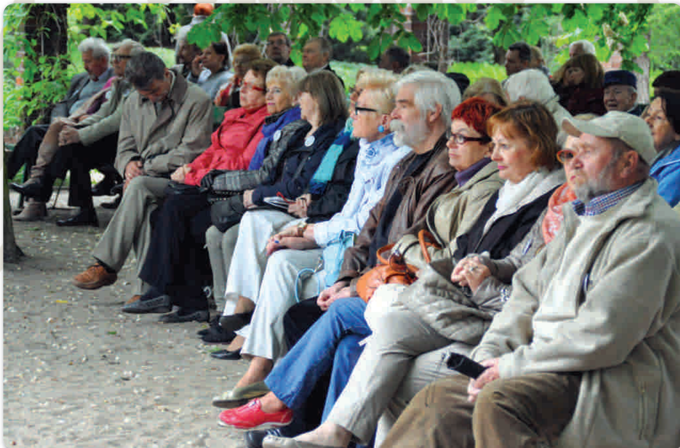
Z zainteresowaniem wysłuchano wystąpień przewodniczących i znanych absolwentów