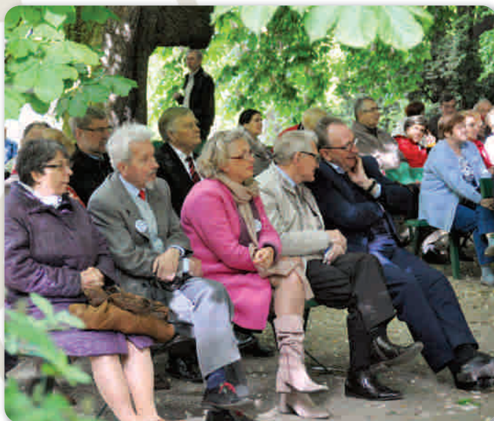
Z zainteresowaniem wysłuchano wystąpień przewodniczących i znanych absolwentów